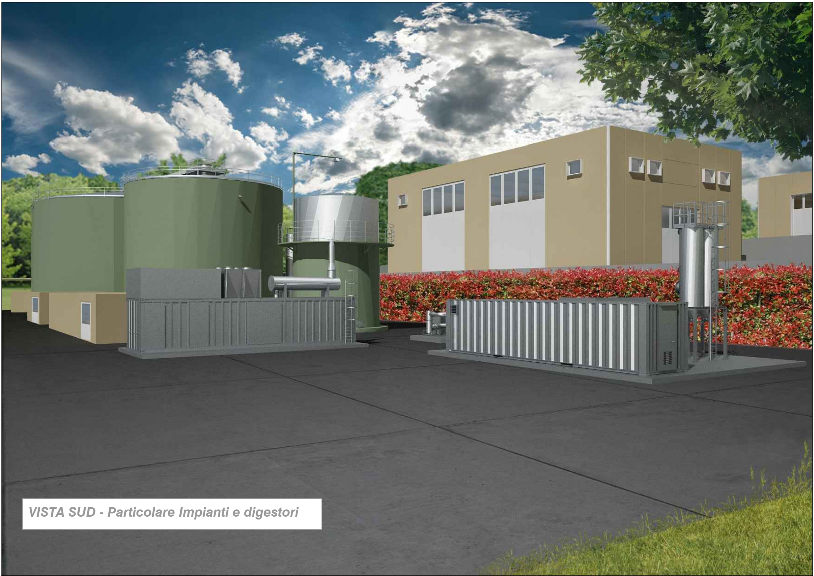
VISTA SUD - Particolare Impianti e digestori