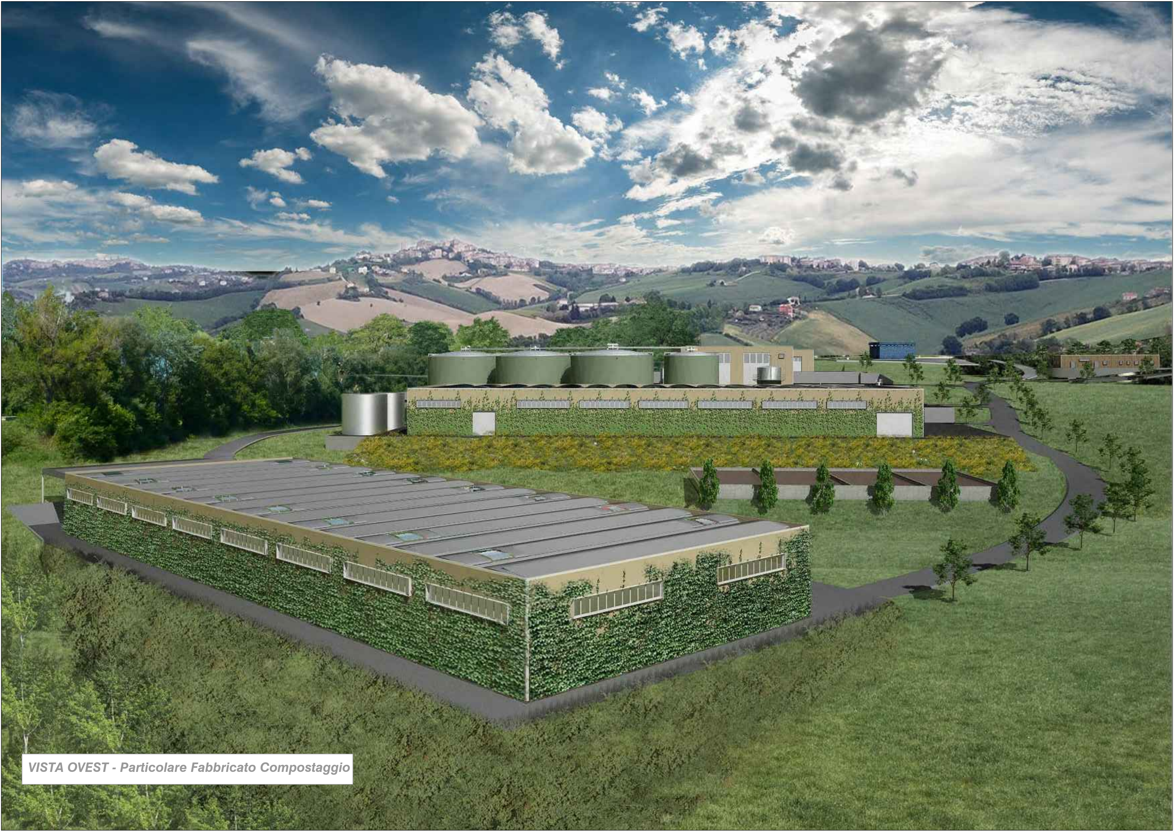
VISTA OVEST - Particolare Fabbricato Compostaggio