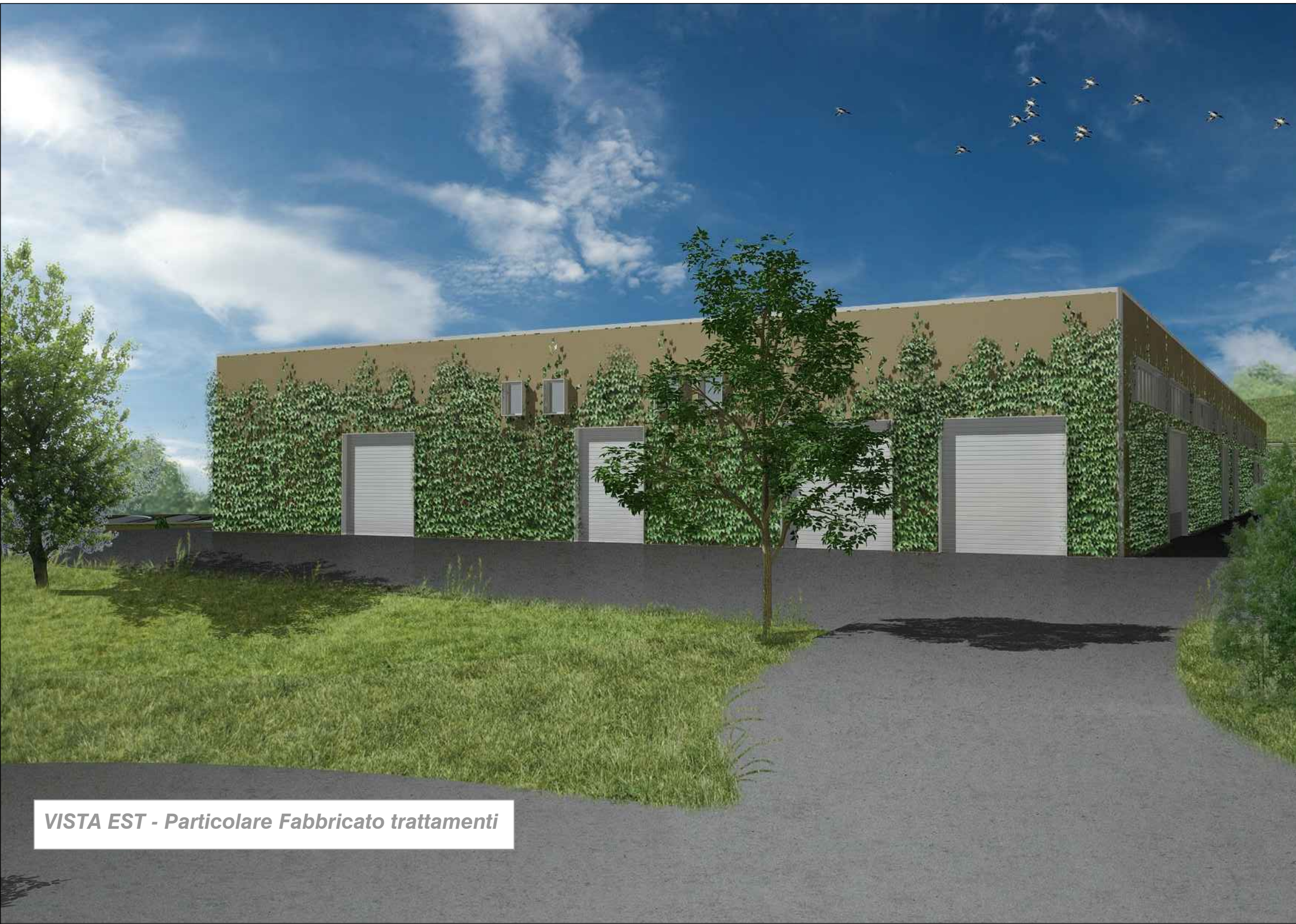
VISTA EST - Particolare Fabbricato trattamenti