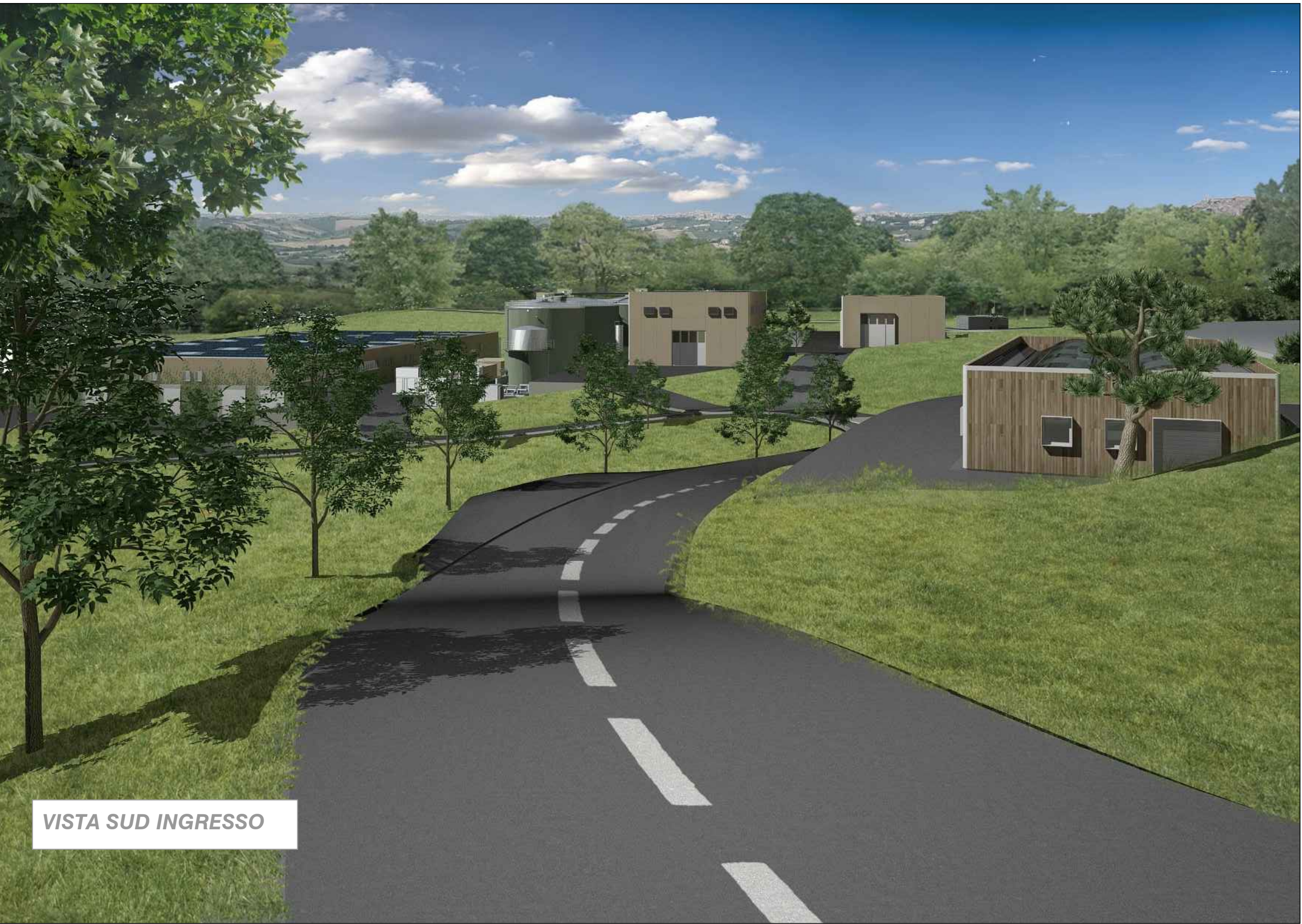
VISTA SUD INGRESSO