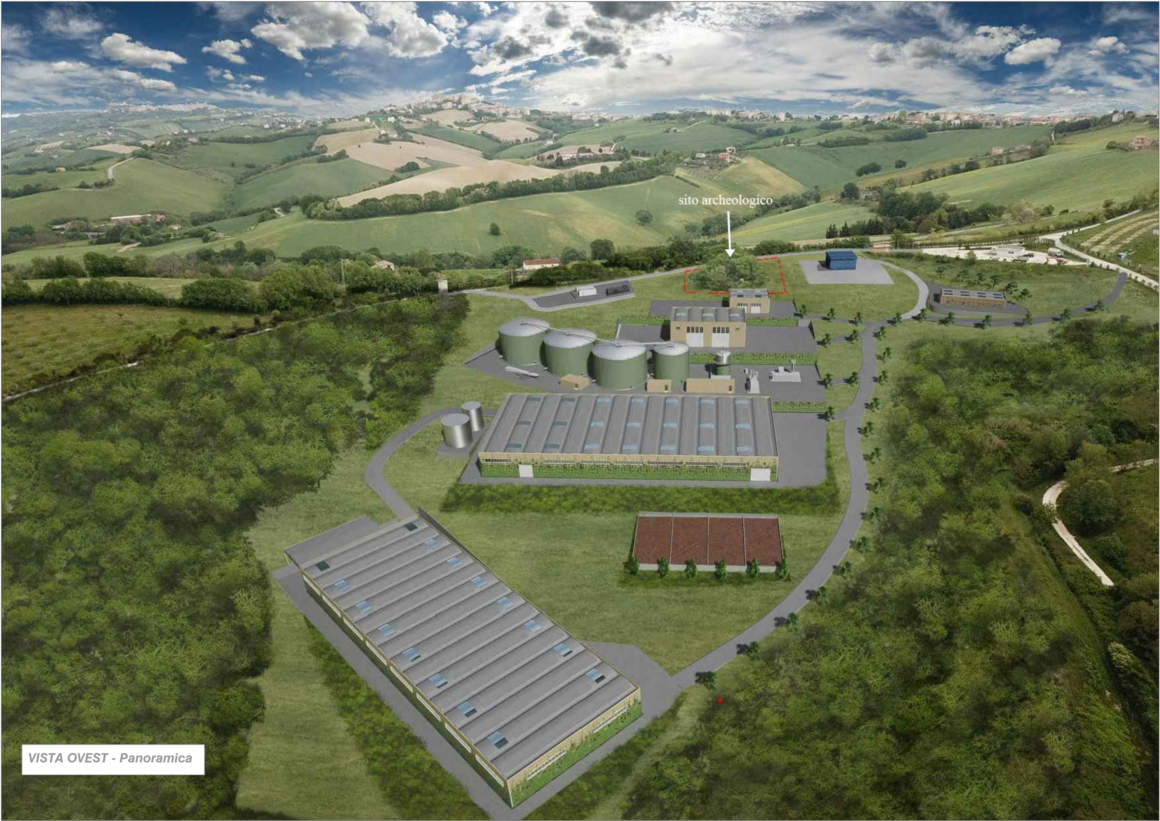
VISTA OVEST - Panoramica